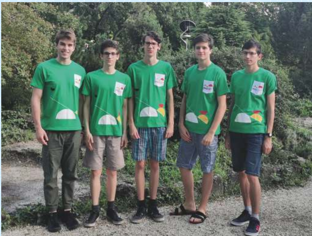
A kép a Margitszigeten készült